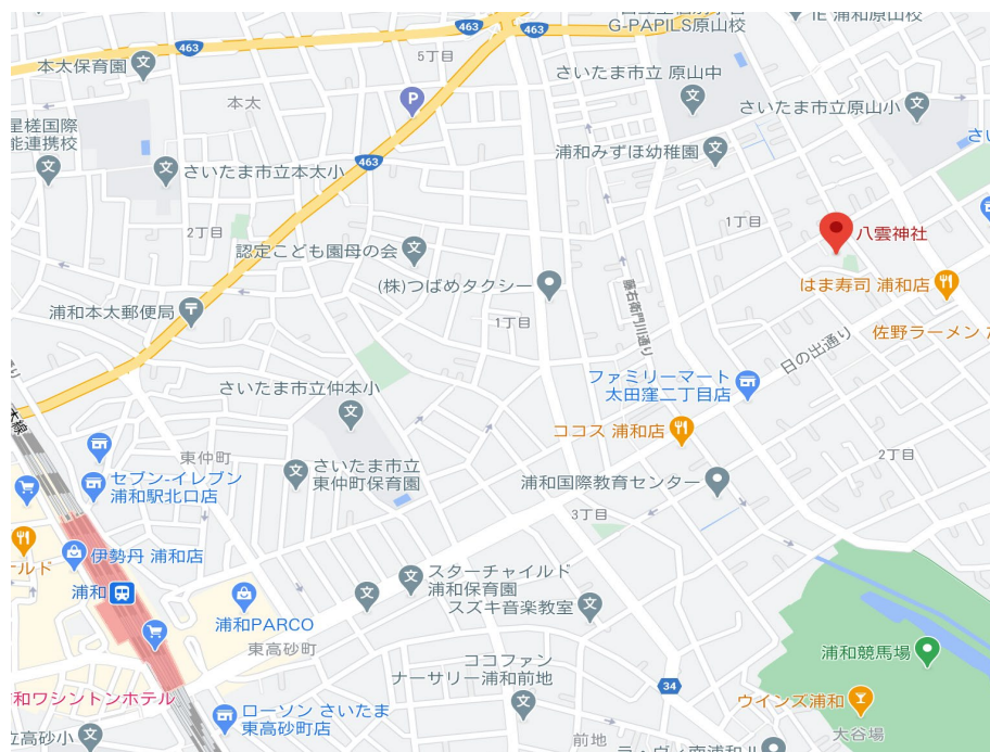
(浦和駅東口から徒歩15分)